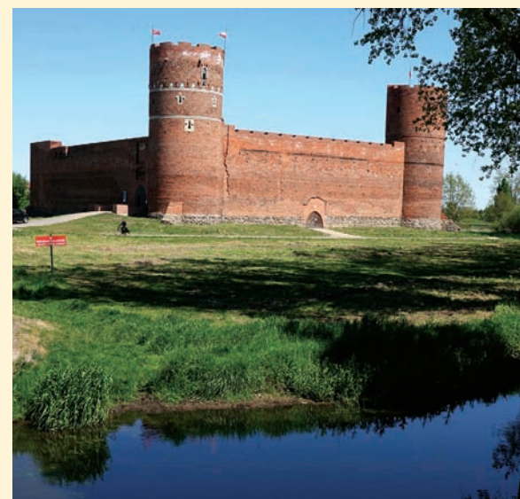
Czyt. str. 13