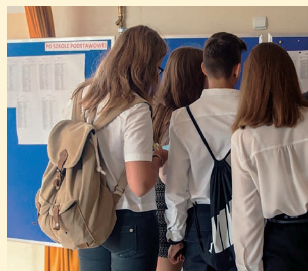
Czyt. str. 11