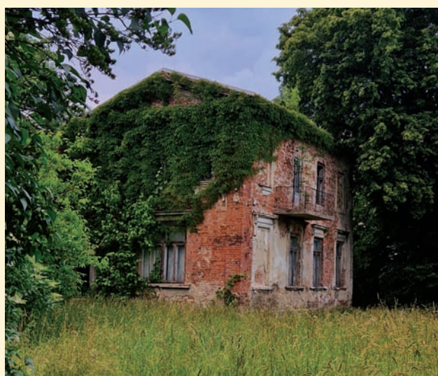
Czyt. str. 4