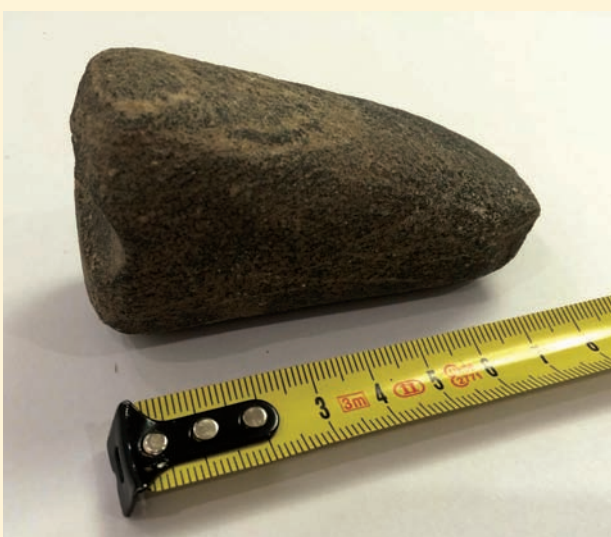
Czyt. str. 4