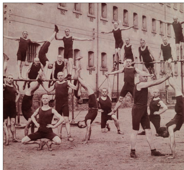
Więzienny zespół gimnastyczny, więzienie w Rawiczu k. Poznania 1936.