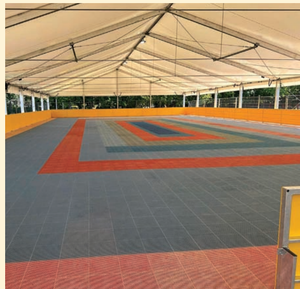
Czyt. str. 4