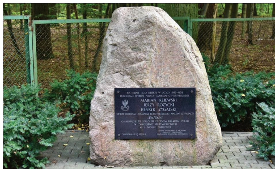
Upamiętnienie trójki kryptologów w Lesie Kabackim w Warszawie.