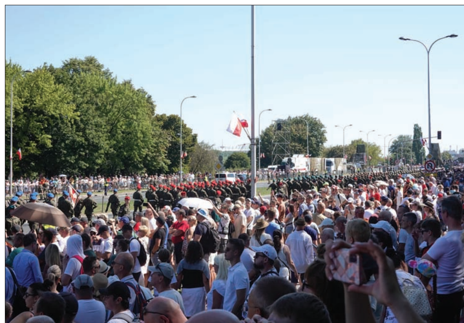
Defilad 15.08.2023. Na fotografii widać, że na zachodnim poboczu Wisłostrady kłębią się niezliczone tłumy.