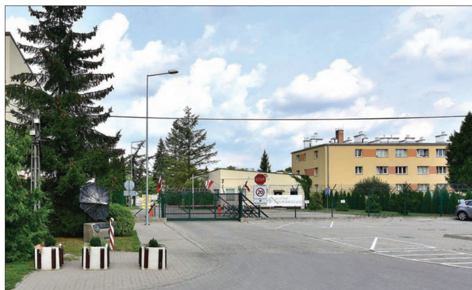
Centrum Operacji Powietrznych - Dowództwo Komponentu Powietrznego ul. Kajakowa 8.