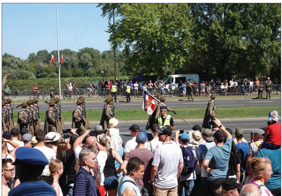
Defilad 15.08.2023. Na fotografii widać, że na wschodnim poboczu Wisłostrady prawie nie ma widzów.