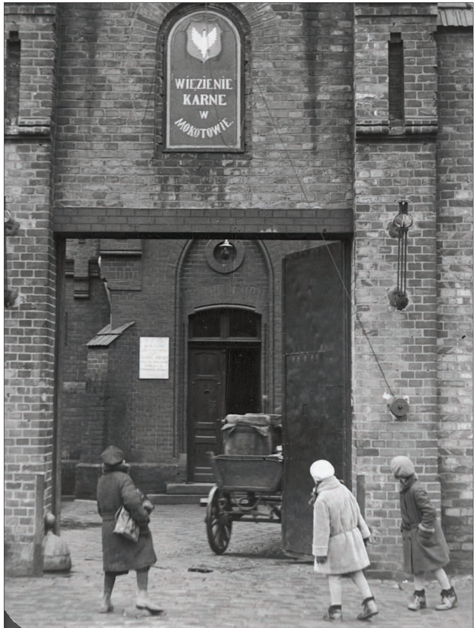
Wejście główne do Mokotowskiego Więzienia przy ul. Rakowieckiej, ok. 1930 roku.

Pierwszym zwiastunem tego sportowego planu penitencjarnego była krótka notka w „Przeglądzie Sportowym”, zamieszczona w 1928 roku: „W więzieniu mokotowskim zostanie ukończona w najbliższych dniach specjalna sala gimnastyczna dla więźniów. Minister-