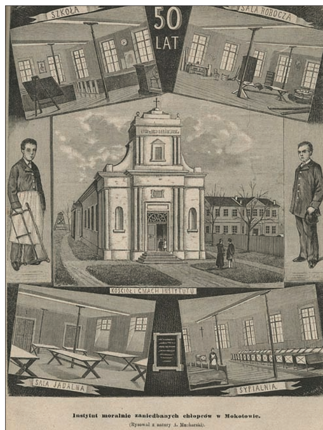
Kościół, gmach główny i poszczególne sale Mokotowskiego Instytutu dla Moralnie Zaniedbanych Dzieci, ilustracja z Biesiady Literackiej z 1880 r.