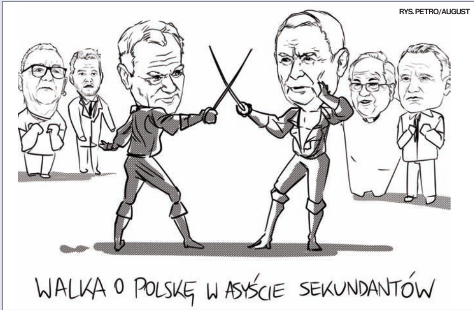
WALKA O POLSKĘ W ASYŚCIE SEKUNDANTÓW

Po setkach lat wspólnego bytowania na terenach zwanych przez nas kresami, po okresie na pół niewolniczych upokorzeń Kozaków, po wojnie o Lwów w 1918, po zdegradowaniu Ukraińców do roli uboższego krewnego w międzywojniu i po tragedii, jaką był ukraiński krwawy rewans na Polakach podczas drugiej wojny światowej (rzeź wołyńska!) – chcieliśmy uwierzyć niedawno w pojednanie obu narodów. A tu masz babo plack! Morawiecki rzucił brutalnie w twarz Ukraińcom, żeby się gonili ze swoim zbożem i nie liczyli już na dosyłanie polskiej broni. Dopiero dyplomatyczna reakcja wielu krajów przywołała obóz kaczystowski w Polsce z Morawieckim an der Spitze – do porządku. I w końcu zaproponowano Ukrainie eksport przez Polskę – z wykluczeniem sprzedaży zboża na naszym terytorium. Jakby takiej, dokładnie kontrolowanej formuły nie mógł polski rząd realizować wcześniej, miast tego pozwalając różnym